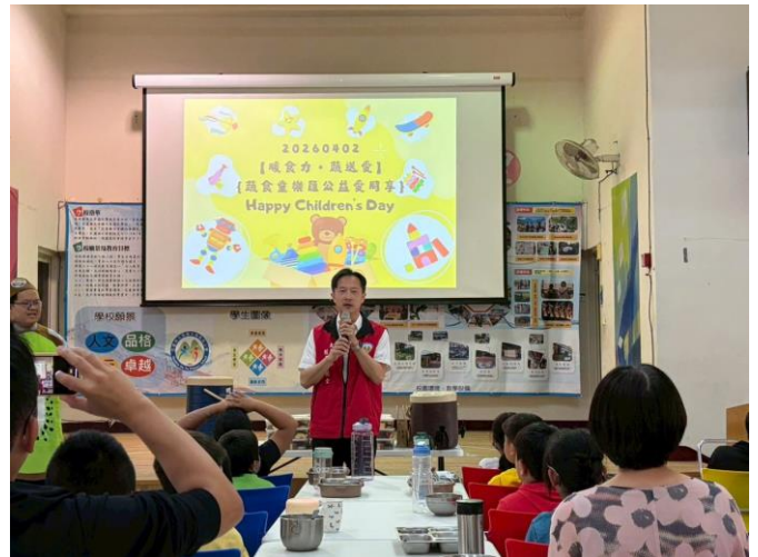
慈濟蔬食同樂·暖食力蔬送愛 2026. 04. 02