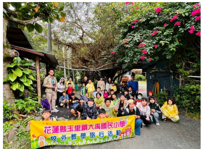
宜蘭活化課程校外教學 2026. 03. 26-27