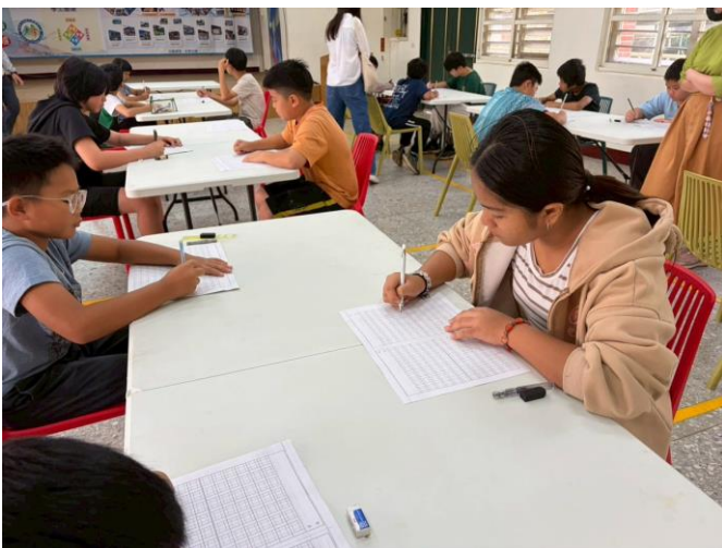
作文學藝競賽 2026. 04. 17