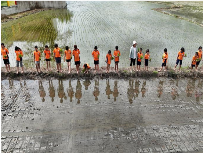
校本插秧課程 2026. 03. 09