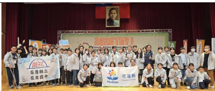
(1) 花蓮縣大放異彩 勇奪 2026 IEYI 臺灣賽 4 金 6 銀 12 銅及特別獎-新頭條 115.1.30.