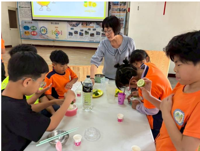
營養教育宣導・檸檬汁 DIY 2026. 03. 16