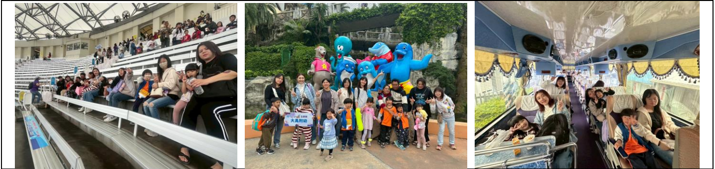
3月花蓮縣兒童節-海洋公園活動