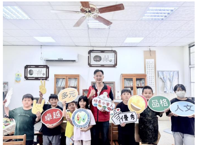
校本課程成果發表