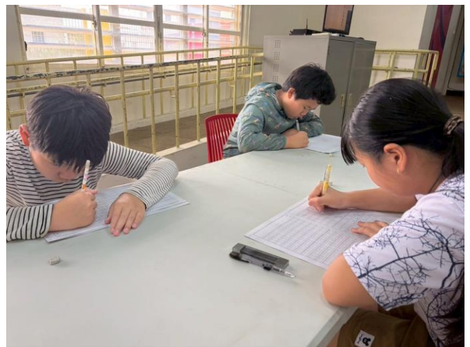
作文學藝競賽 2026. 04. 17