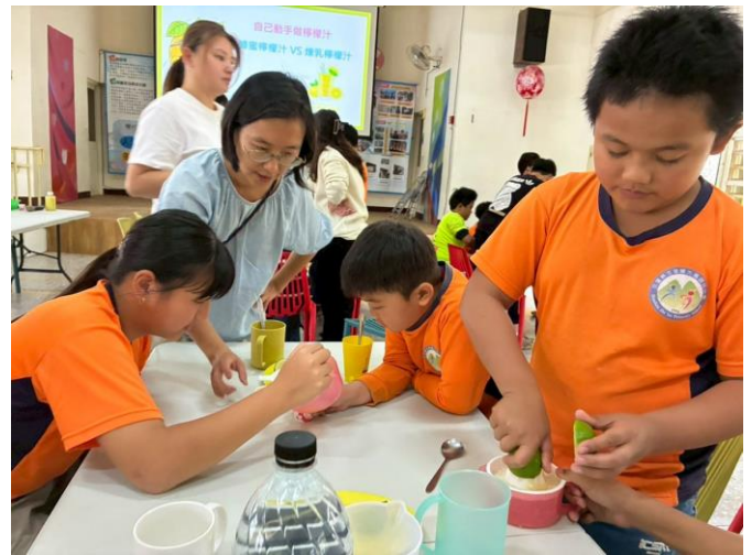
營養教育宣導・檸檬汁 DIY 2026. 03. 16