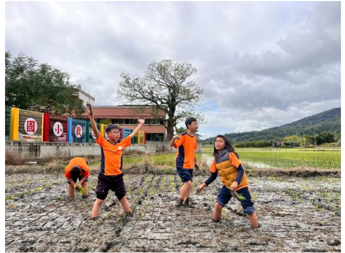
校本插秧課程 2026. 03. 09