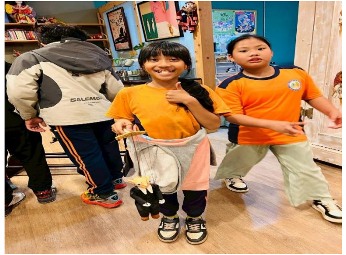
宜蘭活化課程校外教學 2026. 03. 26-27