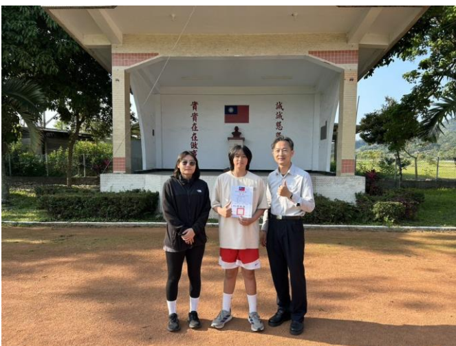
花蓮縣小學田徑排名賽