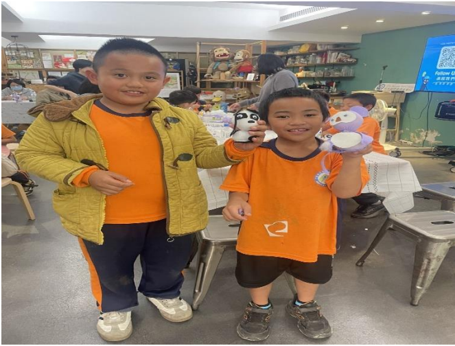
宜蘭活化課程校外教學 2026. 03. 26-27