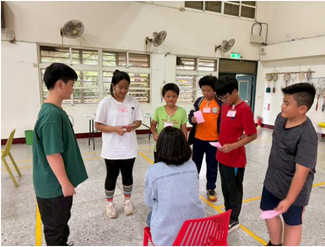
花蓮品格營 2026. 05. 04-07