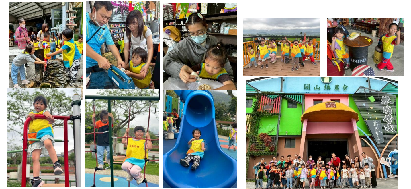
4月三校附幼聯合校外教學米國學校、鯊魚公園