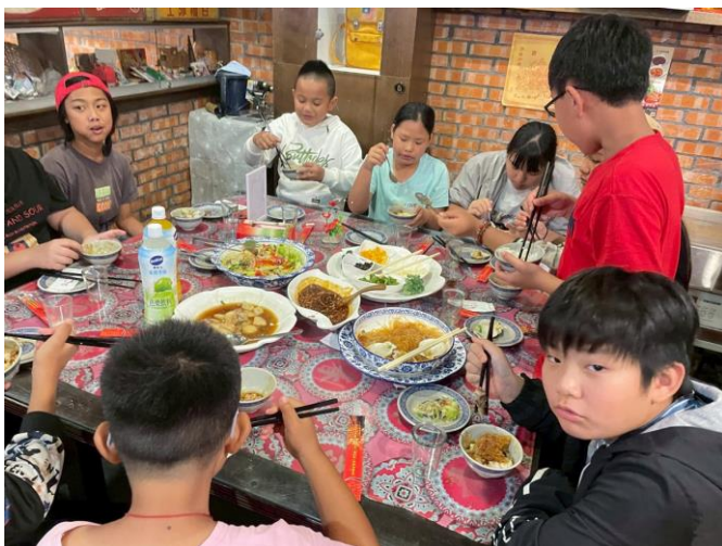
宜蘭活化課程校外教學 2026. 03. 26-27