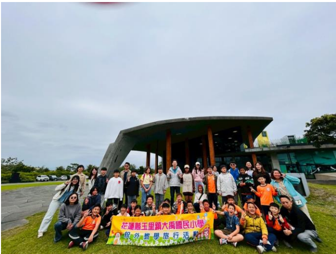
宜蘭活化課程校外教學 2026. 03. 26-27