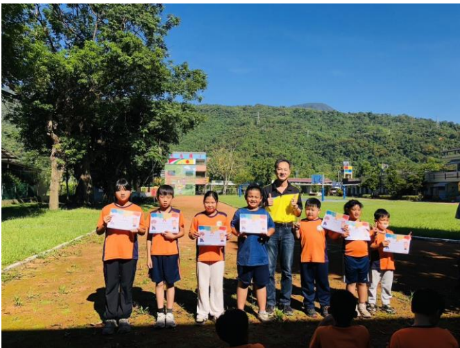
校長小客人·品格教育