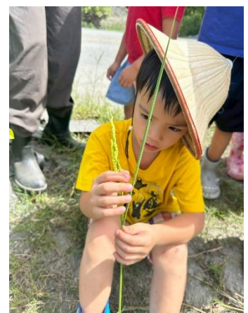
主題課程-來稻大禹