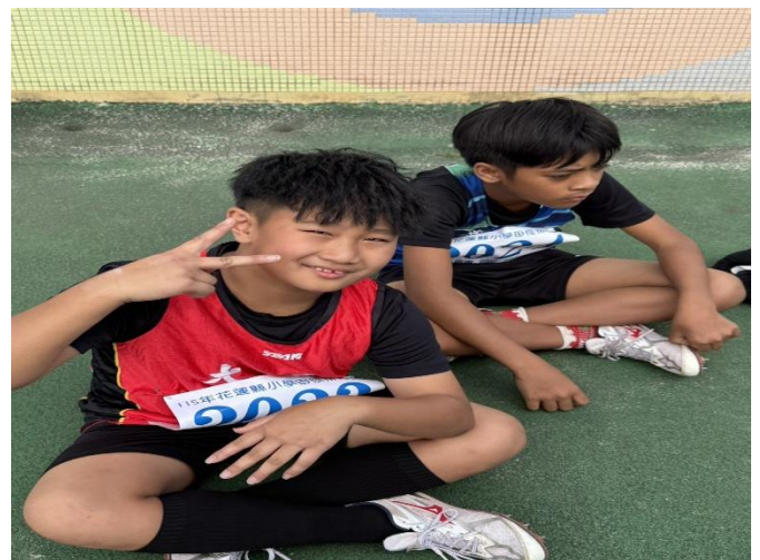
花蓮縣小學田徑排名賽