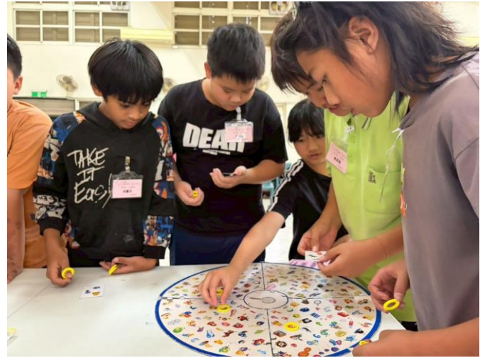
花蓮品格營 2026. 05. 04-07