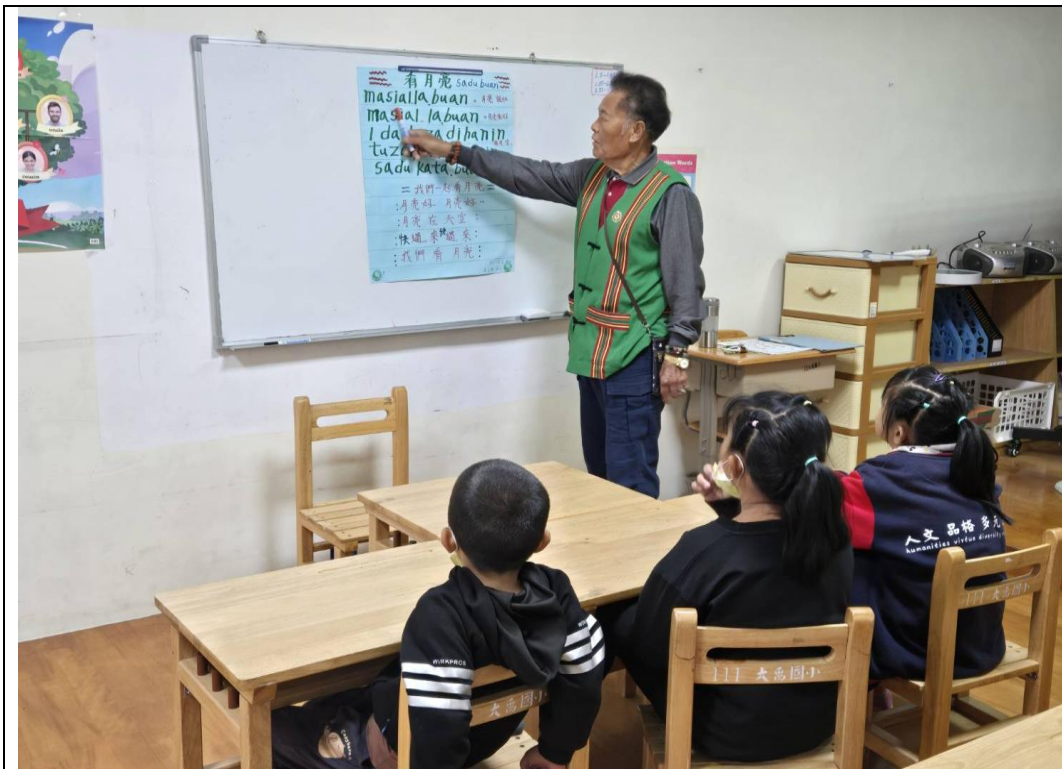
相片1說明：布農語老師利用自製海報教唱布農語傳統歌曲及羅馬拼音教學